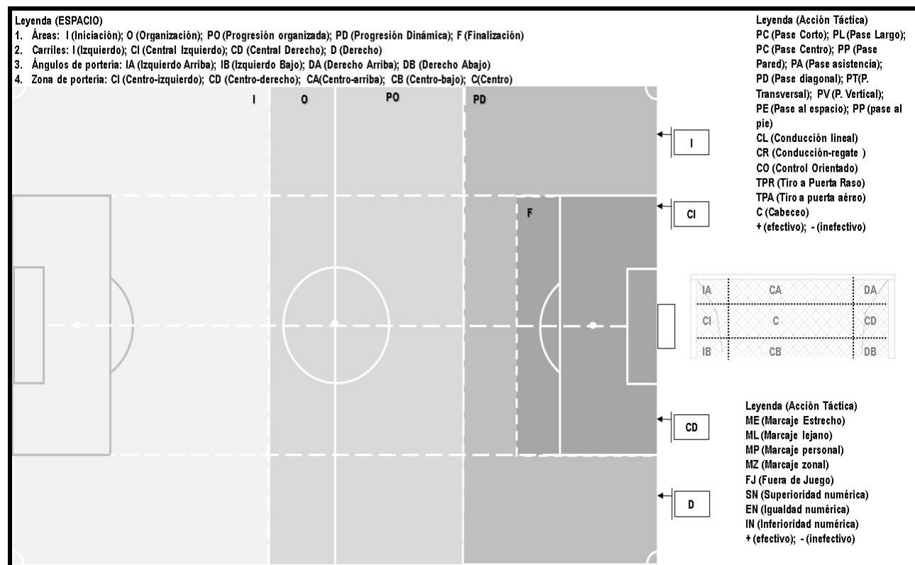
Grafico no. 2 Protocolo de observación del comportamiento estratégico-táctico ofensivo

En el caso de los test se utilizan las pruebas normadas a través del Programa de Preparación Integral del Futbolista. Las encuestas y entrevistas deben esclarecer los elementos fuertes y débiles en el comportamiento de los siguientes indicadores: desempeño individual del futbolista, desempeño del o los adversarios que jugaban próximos o en su área de acción, desempeño colectivo del equipo y desempeño colectivo del equipo adversario.