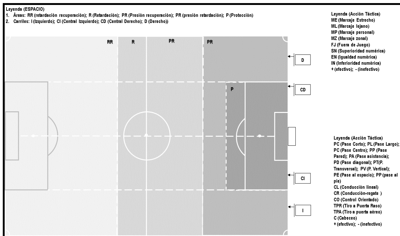
Grafico no. 3 Protocolo de observación del comportamiento estratégico-táctico defensivo