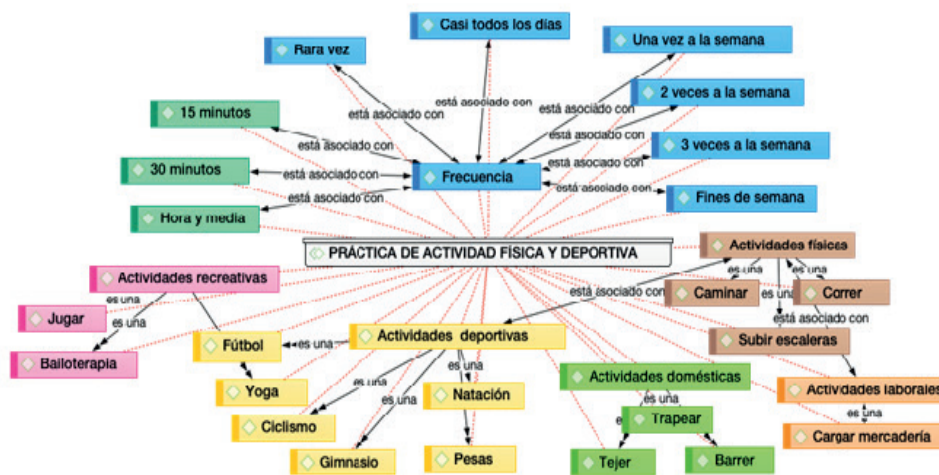
Figura 2. Red de la categoría práctica de actividad física y deportiva

En cuanto a la frecuencia de la práctica, esta varía desde todos los días hasta rara vez, destacándose con mayor frecuencia los fines de semana. En cuanto al tiempo que dedican a realizar actividad física este va entre 15 minutos diarios hasta una hora treinta minutos. En este contexto hay entrevistadas que mencionan: